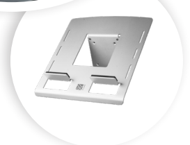
R-GO MORELIA LAPTOPHOUDER